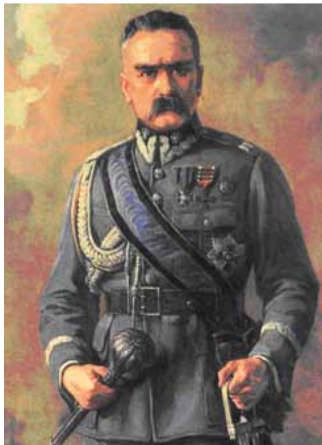
Marskalk Józef Piłsudski (1867–1935) var först kommandant för Polska legionen under det första världskriget och senare Polens förste president 1918–1922 efter statens utropande. Därefter blev han president även för en andra period 1926–1935.