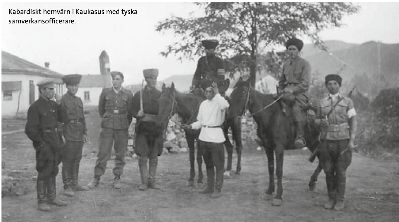
Kabardiskt hemvårn i Kaukasus med tyska samverkansofficerare.

ska rebellerna verkligen samarbetade med tyskarna. Faktum är att ett stort antal tjetjener stred med hög motivation på den sovjetiska sidan mot den tyska invasionen. Men det väpnade upproret och tjetjenerna som lät sig värvas av Abwehr gav Stalin förevändning till den omänskliga deportering av hela Tjetjeniens och Ingusjiens befolkning som iscensattes i februari 1944. Under täcknamn operation "Lentil" lastades helt enkelt 478 000 män, kvinnor och barn ombord på järnvägsvagnar och deporterades till Centralasien. ●