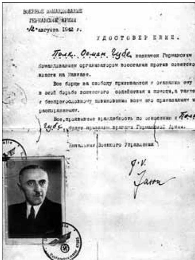
Osman Gube (1892–1943), författare och nationalist.

Vid den här tiden åtnjöt "vita" exilorganisationer sympati och stöd från flera europeiska stater, inte minst Polen. Under de första åren av sin existens utmärkte sig den nya polska repu-