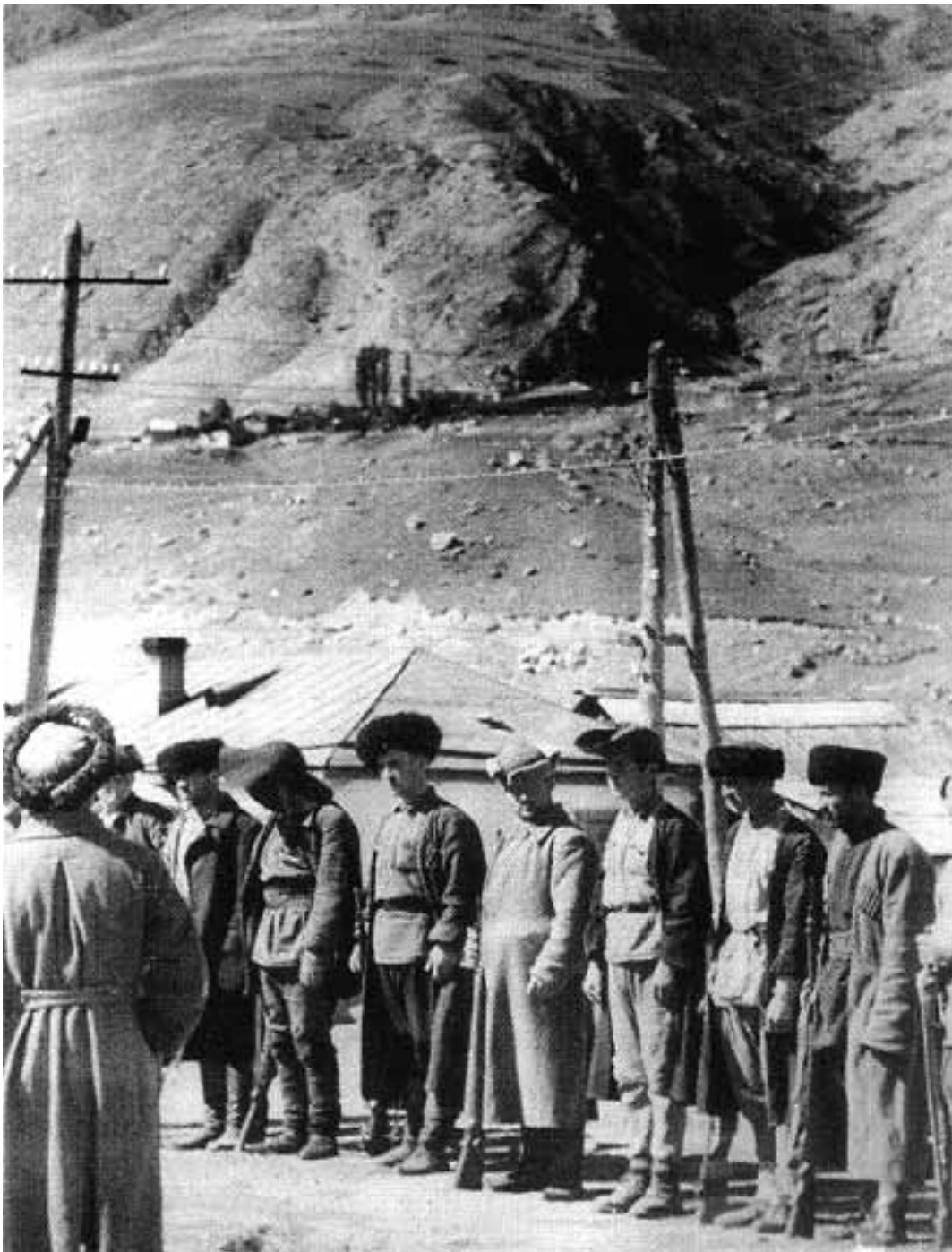
Ett första kaukasiskt hemvärn har bildats. Den sovjetiska repressionen blev förfärlig.

Istället dök nya aktörer upp på scenen. Prometeismen togs nu upp av Frankrike och Storbritannien. Faktum är att dessa båda länder vintern 1939–1940 planerade för ett angreppskrig mot Sovjetunionen, bland annat från Mellanöstern mot det ol-