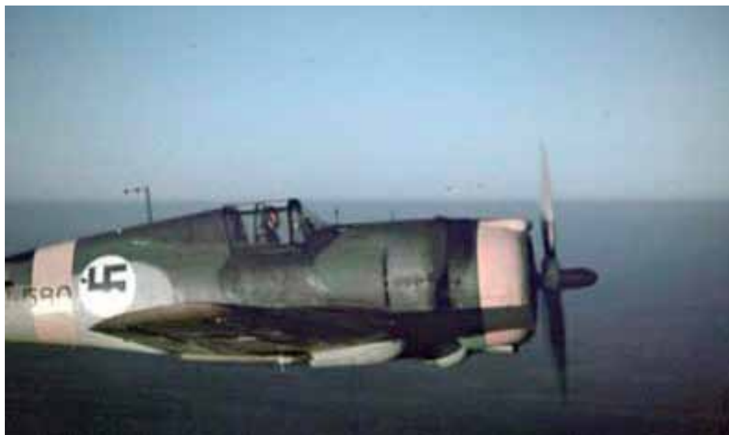
Curtiss Hawk – amerikanskt jaktplan i finsk tjänst.

Finländarna hade inte mycket att sätta upp mot Hangöba-