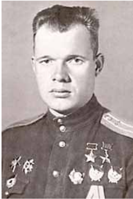
Löjtnant Vasilij Golubev – sovjetisk stridsflygare.