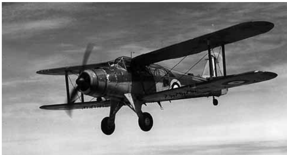
Fairey Albacore skulle ersätta Fairey Swordfish, men gammal visade sig bäst!

som därmed gick miste om vad som varit en av dess viktigaste spioncentraler i kriget – ambassaden i Helsingfors. Därmed inleddes nedräkningen för den brittiska krigsförklaringen mot Finland. Denna följde den 6 december 1941, på Finlands självständighetsdag. ●