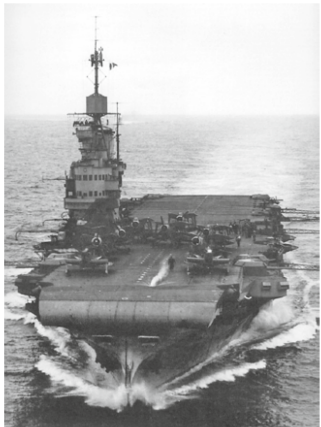
Hangarfartyget Victorious med jaktplanet Fairey Fulmar och torpedbombplanet Fairey Swordfish ombord.