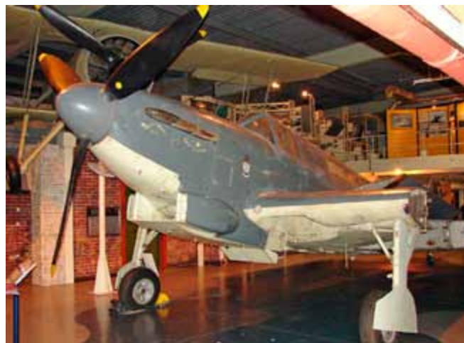
Fairey Fulmar var brittiska flottans jaktplan även om den mer liknade bombplanet Fairey Battle.

som därmed gick miste om vad som varit en av dess viktigaste spioncentraler i kriget – ambassaden i Helsingfors. Därmed inleddes nedräkningen för den brittiska krigsförklaringen mot Finland. Denna följde den 6 december 1941, på Finlands självständighetsdag. ●