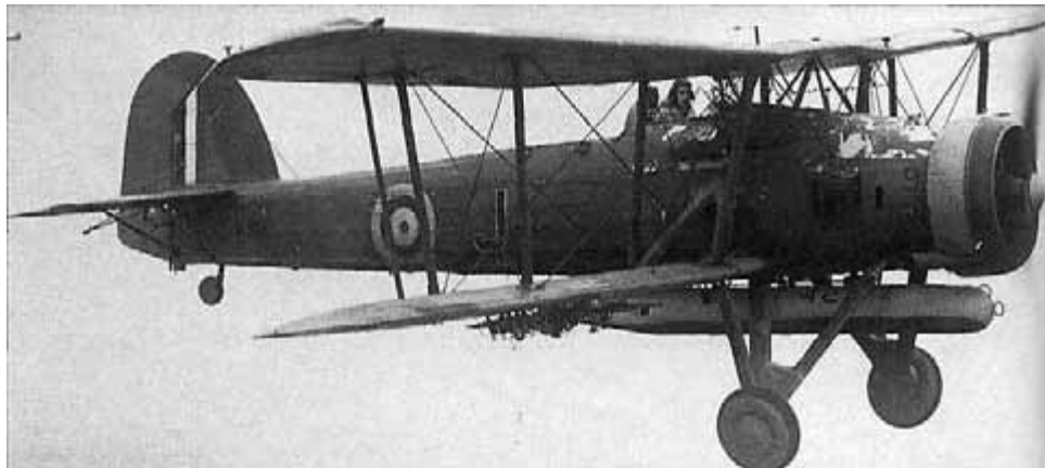
Fairey Swordfish "the Stringbag" var föråldrat vid andra världskrigets utbrott men blev legendariskt för sina insatser mot italienska flottan i Taranto och jakten på tyska slagskeppet Bismarck .

Diplomatiskt innebar bombningen av finskt territorium ett ytterligare bakslag för britterna. Den ledde till att finländarna lät bryta de diplomatiska förbindelserna med Storbritannien,