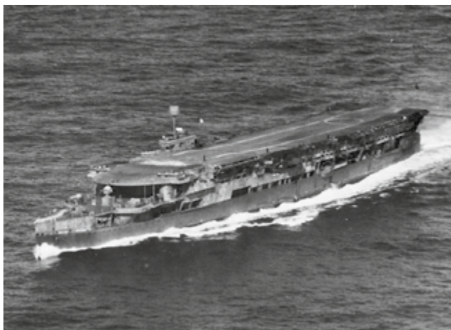
Hangarfartyget Furious deltog såväl i Norgekampanjen 1940 som i senare flygattacker mot tyska mål i Norge, bland annat mot Tirpitz i Altafjorden.